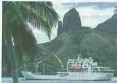
Die „Aranui“ vor Ua Pou.

Unser erster marquesischer Morgen dämmt vor Ua Pou. Die „Aranui“ liegt am Pier von Hakabau. Doch schon der nächste Landgang in Hakahetau am anderen Ende der Insel wird wie fast alle folgenden beginnen: mit einem beherzten Schritt von der Außentreppe an der Bordwand ins Walboot, das sich in den Wogen einen guten Meter auf- und abbewegt und uns an Land bringt. Dass dieses Manöver immer gut geht, auch die zarten Goldhochzeiter aus Oregon nicht einmal wanken, ist den Matrosen zu verdanken. Diese Männer haben noch niemanden fallen lassen, und man spürt sofort, dass sie das auch künftig nicht tun werden. Wenn es die Situation erfordert, nehmen sie