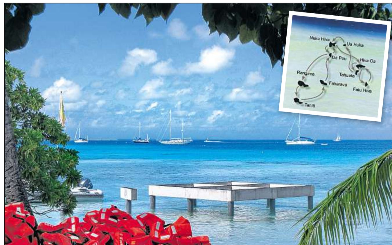
Schaukelndes Vergnügen: Wenn die „Aranui“ vor Anker liegt, werden die Passagiere mit Beibooten an Land gebracht (links). Bei hohem Wellengang ist das eine kippelige Angelegenheit. Die Atolle der Tuamotos, ein Schiffstag von Tahiti entfernt, liegen wie Konfetti im Meer und entsprechen dem gängigen Südsee-Idyll. Die Karte zeigt die Route des Frachters.