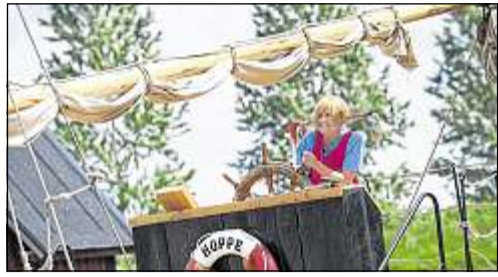
Pippi hat Geburtstag: Im schwedischen Vimmerby dreht sich alles um die Welt von Astrid Lindgren. Ihre Figur Pippi Langstrumpf wird schon 70 Jahre alt. Im Innern