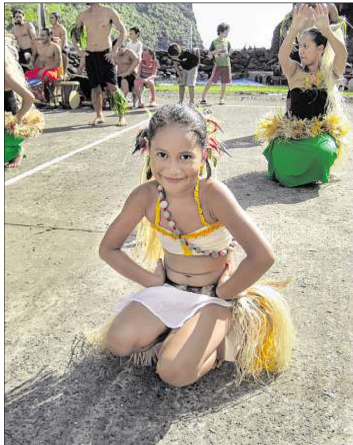
Musik im Blut: Schon die Jüngsten lernen die traditionellen Tänze auf den Marquesas.