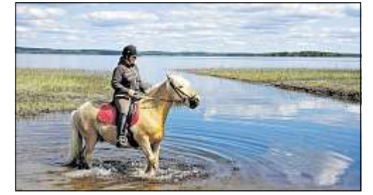
Wintergefühle im Sommer: Das finnische Vuokatti ist einer der populärsten Wintersportorte des Landes. Im Sommer kann man dort durch einen Tunnel skaten. Im Innern

Samstag, 28. / Sonntag, 29. Mai 2011 · 66. Jahrgang · Nr. 21